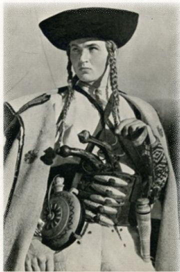
JÁNOŠÍK hrdina Slovákov. 466

Juraj Jánošík bol udatný odvážny už za mlada. Všeličo povyvádzal, ukradol, ba aj z hajdúchov a pandúrov si žarty urobil. Keď vyrástol, chcel sa dať aj na zboj. Nuž, ako si zaumienil, tak aj urobil. Odišiel do hôr a vyhľadal jednu zbojnícku družinu. Chcel do nej vstúpiť hneď, ale povedali mu, že najskôr musí urobiť skúšku. Tá skúška vyzerala takto: musel vyskočiť do výšky a odňať valaškou jedľovú halúzku. Keď už toto náš zbojník Jurko urobil, zbojníckej skupine sa dostal na miesto hajtmana. A tak náš Jurko začal zbíjať. Ale nezbíjal ako iný chamtiví zbojníci. Keď ozbíjal nejaký parádny hintov, všetko z neho zobral chudobným porozdával. Ale jeho sila vyplývala s tohto. Keď putoval k zbojníkom, cestou k nemu prišli tri víly. Jedna mu dala opasok, druhá košeľu, tretia valašku. Ale sláva Juraja Jánošíka a jeho družiny netrvala dlho. Keď raz vošiel do jednej krčmy, hostinská ho podviedla. Hodila mu suchý hrach pod nohy. Pandúri potom vyšli zo svojho úkrytu v pivnici a všetkých ich pochytali. Jánošíka po súde popravili tak, že ho za ľavé rebro zavesili na hák. Jeho najlepšieho kamaráta z družiny popravili tak, že ho dali lámať v kolese. Tak sa skončila púť najslávnejšieho slovenského zbojníka Juraja Jánošíka, narodeného v roku 1688 v podhorskej dedine Terchová.