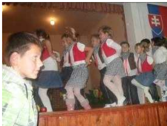
najmenší v akcii